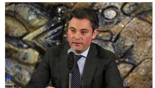
Aurelio Nuño Mayer.

Explicó que en abril se dará a conocer el nuevo modelo educativo junto con los planes y programas de estudio en Educación Básica y Media Superior. “Serán documentos terminados, mas