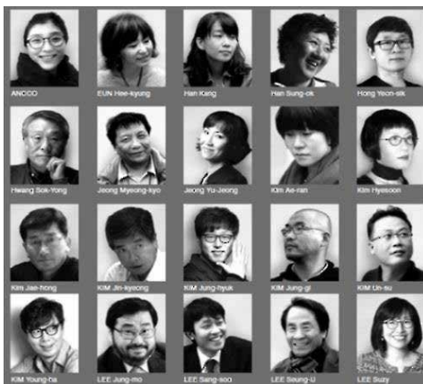
Imágenes de 20 autores invitados al Salón del Libro de París 2016.

Antes del comienzo de la feria, los líderes de la industria editorial de los dos países mantendrán una conferencia en el centro nacional de libros franceses, en París, el 16 y 17 de marzo, para