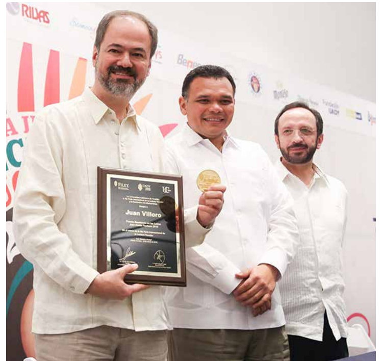
Recibe Juan Villoro el Premio Excelencia en las Letras José Emilio Pacheco.

Y es que la FILEY se ha convertido en el máximo escaparate literario del sureste del país. En esta ocasión supera las 400 editoriales y reúne a más de 150 autores, y a lo largo de 10 días tendrá más de 800 eventos, entre presenta-