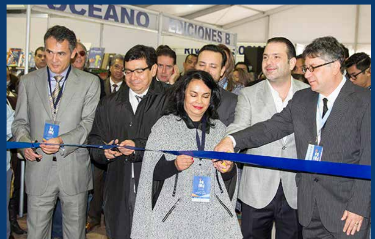
Inauguración de la Feria Internacional del Libro en Benito Juárez.

En esta ocasión se acondicionaron alrededor de 100 stands en los que participan más de 50 casas editoriales, las cuales son invitadas por la Cámara