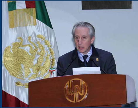
Joaquín Díez Canedo Flores.

Por su parte, el director general de la CONALITEG, Joaquín Díez Canedo Flores, expresó que en 10 años del programa “Recicla para leer” se ha captado 214 mil toneladas de papel de desperdicio y